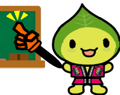
はいえい人街ネット イメージキャラクター 『みちのこはっぴ〜くん』